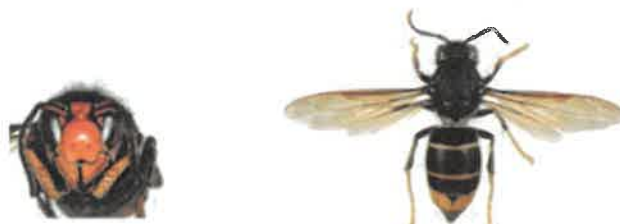
Frelon asiatique à pattes jaunes, Vespa velutina

Le frelon est reconnaissable car il est majoritairement noir, avec une large bande orange sur l'abdomen et un liseré jaune sur le premier segment. Sa tête vue de face est orange, et les pattes sont jaunes aux extrémités. Il mesure entre 17 et 32 mm.